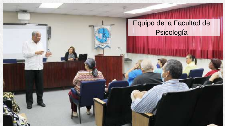
Equipo de la Facultad de Psicología