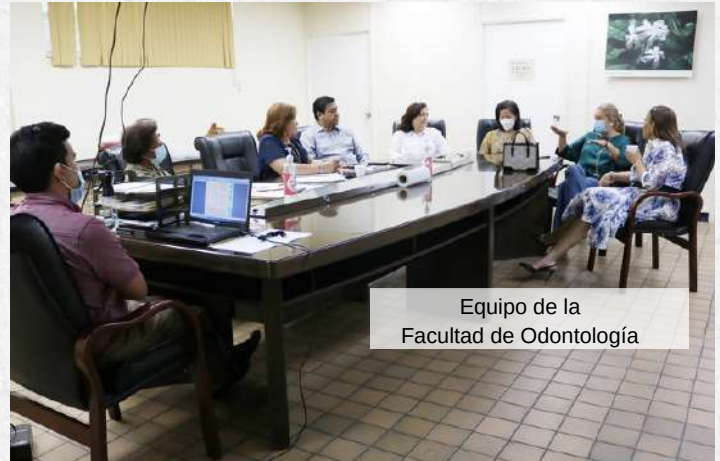
Equipo de la Facultad de Odontología