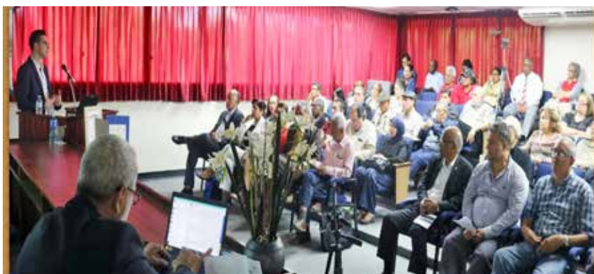
Asistentes a la conferencia.

Por tercer año consecutivo el ICASE pone a disposición de profesores, investigadores, estudiantes y profesionales en general su “Ciclo de Conferencias” . Para el año 2020, el mismo tendrá como lema “La formación docente en el siglo XXI” .