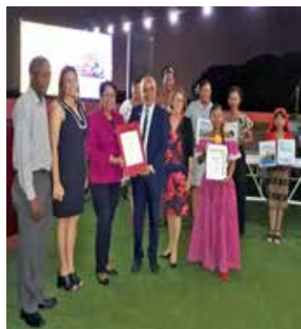
Miembros del ICASE recibiendo los reconocimientos de sostenibilidad y superación otorgado por el SIBIUP en la “Pasarela de publicaciones 2020”.